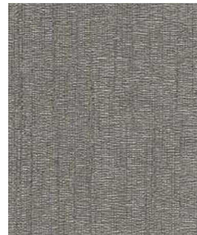
Luxury Metal | 럭셔리 메탈 JG 698