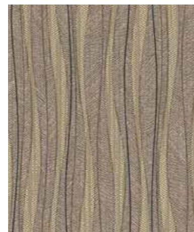
Metal Leaf | 메탈 리프 TG 4004