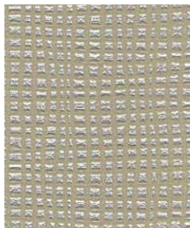
Fabric | 패브릭 SC 792