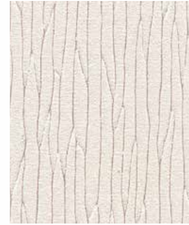
Engraving | 인그레이빙 SC 774