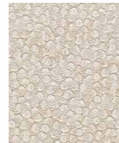
Pebble | 페블 SC 788