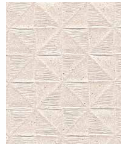
Square | 스퀘어 SE 806