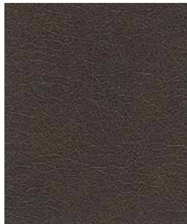
Leather | 레더 MG 460