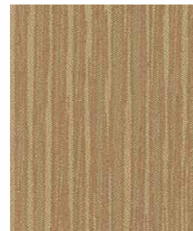
Luxury Metal 럭셔리 메탈 TG/TF 465