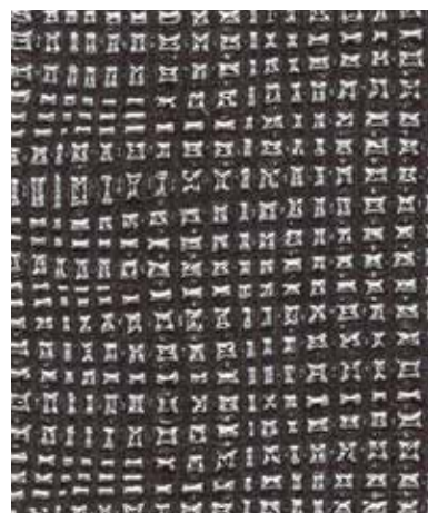
Fabric | 패브릭 SC 793