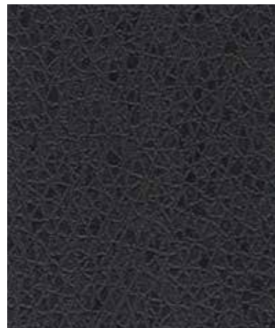
Leather | 레더 TG 410