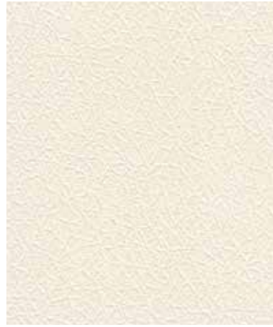
Leather | 레더 TG 4015