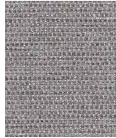
Metal Fabric | 메탈 패브릭 JG 694