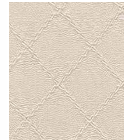
Cross Stripe 크로스 스트라이프 SC 725