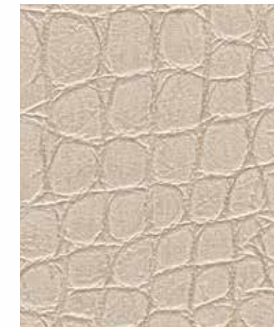
Crocodile | 크로커다일 SC 715