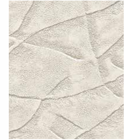
Rock | 락 SP 830